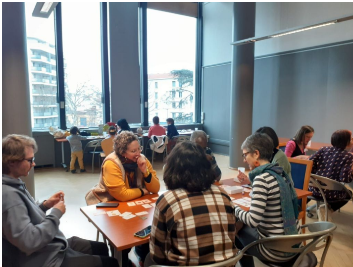
Jeu de la Marmite